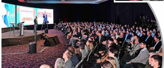
Voces con Energía 2024 de Colbún se realizó este miércoles en el Hotel W Santiago.