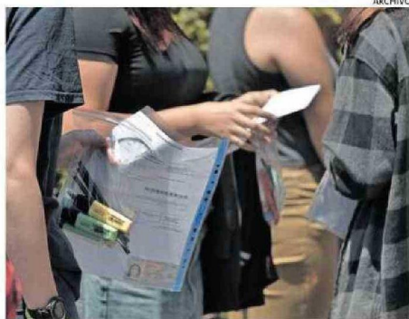
MILES DE ESTUDIANTES RENDIRÁN EL EXAMEN.