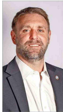
Fernando Ugarte , periodista y candidato a diputado por O'Higgins.