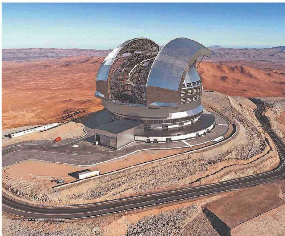
CON UNA PRIMERA INVERSIÓN DE 1.500 MILLONES DE EUROS, ESTA INSTALACIÓN SE UBICA EN EL CERRO ARMAZONES.