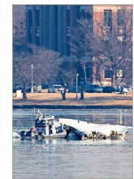
El peor accidente aéreo en dos décadas en EE.UU. deja 67 fallecidos y muchas interrogantes. | A 5

Misivas del genio de la física para su primera esposa provocan una encendida disputa judicial en Nueva York. | A 8