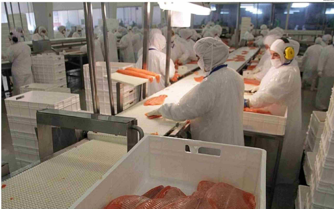
EN PUERTO MONTT SE CONCENTRA LA MAYOR CANTIDAD DE EMPLEOS DE LA INDUSTRIA, LO QUE ES ATRIBUIDO A LA EXISTENCIA DE 18 DE LAS 50 PLANTAS DE PROCESO DE LA REGIÓN.

ponderados promedió la región entre 2005 y 2021, lo que equivale a un 92,4% de la media para el período (16.999).