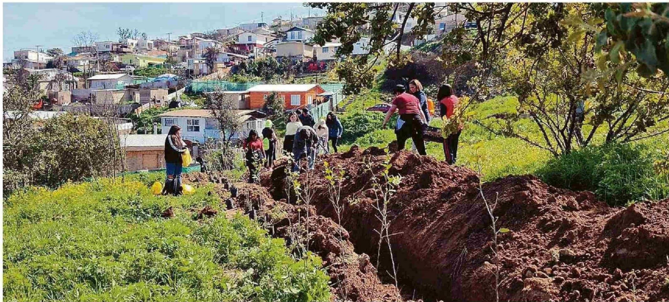
ARBORIZACIÓN URBANA EN VIÑA DEL MAR.

Entre las especies invasoras que afectan a la Región de Valparaíso están el aramo australiano ( Acacia dealbata ), eucalipto ( Eucalyptus globulus ), pino contorta ( Pinus contorta ), zarzamora ( Rubus ulmifolius ), retamilla ( Genista monspessulana ) y dedal de oro ( Eschscholzia californica ).