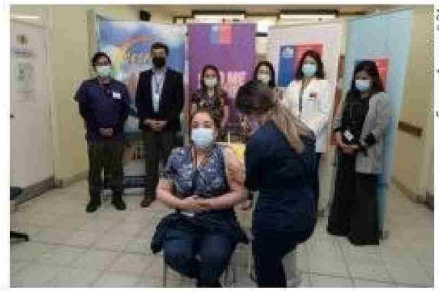
Los momentos más impactantes de la pandemia del covid 19 en la Región de Magallanes.