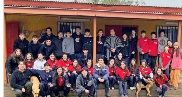
En Guayacán, Cabilido, Valparaíso, el grupo del Colegio San Miguel Arcángel.