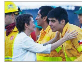
En Talca conmemoró ayer el Día Nacional del Brigadista Forestal.