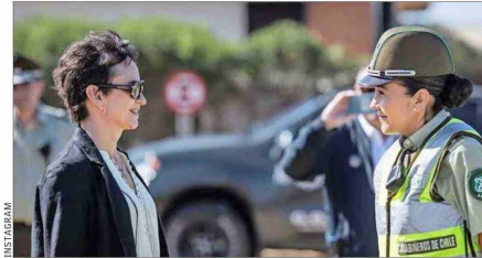
En El Tabo se hizo entrega de cabañas que fueron incautadas.

La activa agenda de la ministra se desarrolla mientras que las dudas en torno a su eventual candidatura presidencial en representación de la izquierda, como han impulsado en su partido (el PPD), no se disipan. Esta semana, consultada nuevamente sobre su eventual postulación a La Moneda, Tohá señaló a marzo como el plazo en que tomará una decisión.