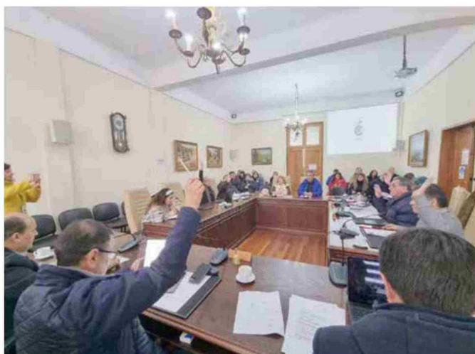
La iniciativa fue aprobada de manera unánime por el concejo municipal de Curicó.

"Este es un proyecto muy significativo, porque lo que hemos hecho durante estos años de administración, ha sido cambiar el sello completamente de lo que era la antigua Escuela Especial,