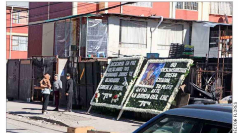
"Sangre por sangre" se podía leer ayer en una de las coronas dejadas en lo que sería el velorio de "El Nano", identificado como traficante en el lugar.

Durante la tarde de ayer fue hallado un vehículo que habría