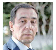
Anuar Quesille, defensor de la Niñez.

convocado a alcaldes y parlamentarios para trabajar en conjunto. Con todo, dijo que "este tema ya no resiste más discusión ni diagnósticos, porque estos ya están hechos, ahora se requiere materializar los compromisos públicos por parte del Gobierno y las autoridades competentes, de manera urgente".