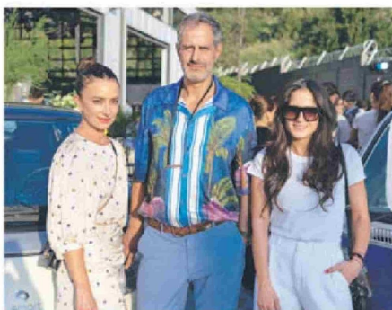
© Tota Echenique, Hugo Grisanti y Daniela Bustamante.