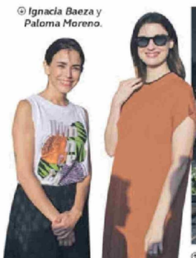
© Ignacia Baeza y Paloma Moreno.