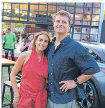
© Paz Vicuña y Cristóbal Mekis.