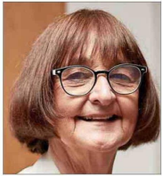
Rosa Devés es la primera rectora mujer de la U. de Chile.