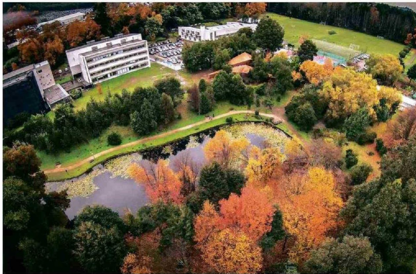
Campus San Juan Pablo II

Para sus estudiantes, muchos de los cuales provienen de contextos vulnerables, la universidad representa una oportunidad transformadora. El Rector Bórquez destaca que “la misión de la UCT es levantar la autoestima de los jóvenes y prepararlos para construir un futuro mejor”.