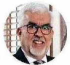
Aliro Bórquez Ramírez, Rector UCT Temuco

Nuestro objetivo no es solo contar con infraestructuras modernas, sino garantizar que nuestros estudiantes y funcionarios se sientan acogidos y orgullosos de pertenecer a esta institución”