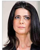
Tendría compromisos impagados por unos $180 millones.

Senado votará en sala reforma que fija umbral electoral a los partidos y establece la pérdida de escaños por renuncia a colectividades | C 4