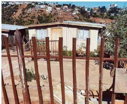
FAMILIAS QUE SIGUEN EN ESTRECHAS VIVIENDAS DE EMERGENCIA.

En Forestal, Nueva Aurora y los sectores aledaños arrasados por el siniestro del 22 de diciembre de 2022, siguen con las huellas imborrables de la tragedia en su diario vivir. Minvu dice que 2 de cada 3 damnificados cuentan con vivienda.