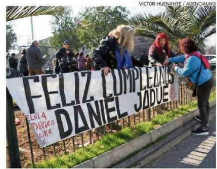
MANIFESTACIONES DE APOYO SE VIVIERON AFUERA DE CAPITÁN YÁBER.