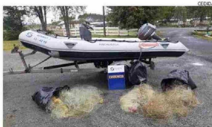
SE HAN DECOMISADO REDES Y SODIAC DE LAS MAFIAS FURTIVAS.