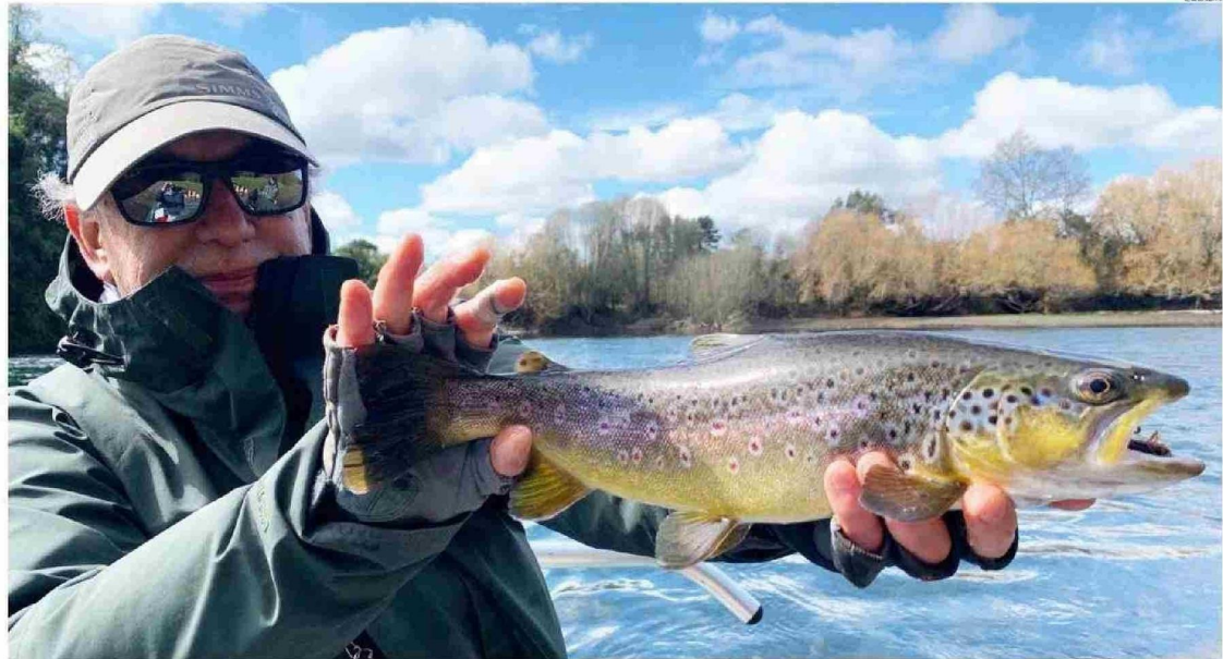
LA APERTURA ANTICIPADA DE PESCA RECREATIVA CORRE SÓLO PARA CINCO CUERPOS DE AGUA DE LA REGIÓN Y ES CON RETORNO OBLIGATORIO DEL PEZ A SU HÁBITAT.

El adelanto de la temporada para estos cinco cuerpos de aguas continentales también significa intensificar los esfuerzos en la lucha contra los pescadores furtivos que actúan du-