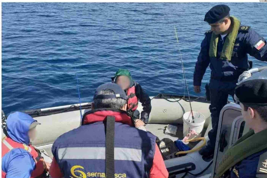
SERNAPESCA FISCALIZA COMO PUEDE, CON ESCASEZ DE PERSONAL, PARA DETECTAR LA PESCA FURTIVA EN LOS RÍOS Y LAGOS DE LA REGIÓN.

En todos estos puntos existen mafias de pesca ilegal que comenzaron a aparecer hace