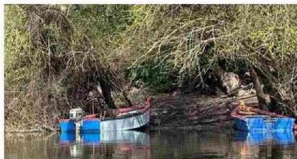
SE HA DETECTADO POR ESTOS DÍAS PESCA DEPREDATORIA EN EL RAHUE.