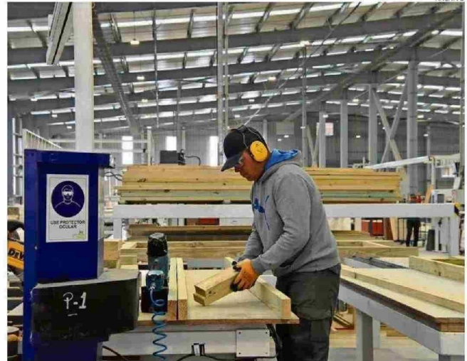
GREMIOS AFIRMAN QUE PESE A AVANCES, HA SIDO INSUFICIENTE PARA SACAR A LA REGIÓN DEL ÚLTIMO LUGAR.

del país. Las recientes inversiones en infraestructura energética, como la nueva subestación Montenegro, han garantizado un suministro eléctrico estable en esta área, facilitando la expansión de empresas como la planta Bimbo y fortaleciendo a Ñuble como un centro