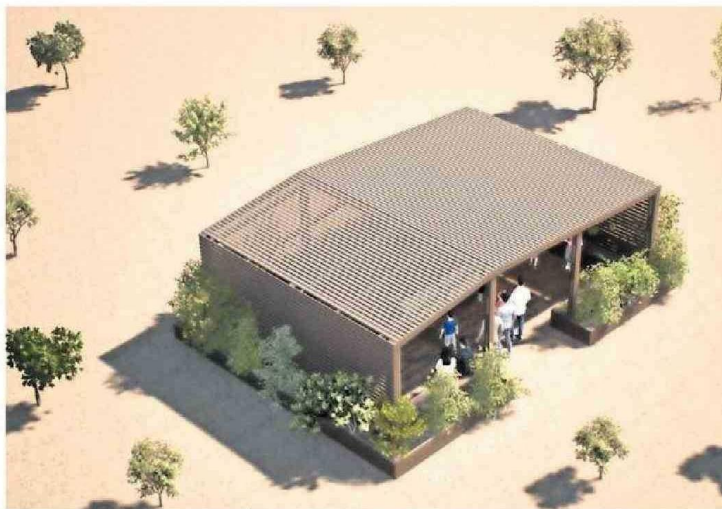
EL LUGAR DE ENCUENTRO QUE ESTARÁ EN MEDIO DEL PARQUE.

Profesionales de la Universidad Andrés Bello se unieron a la iniciativa a través de un proyecto. “Postularon a un fondo de ciencias y lograron ganar, lo que significa la documentación de este proyecto, por ejemplo que puede ser transmitido, que tenga una itinerancia, para exponer nuestra experiencia de cómo hemos ido logrando estos objetivos. Esto se documenta y demuestra que algunas especies pueden crecer en regiones que no son propias”, explicó Astudillo.