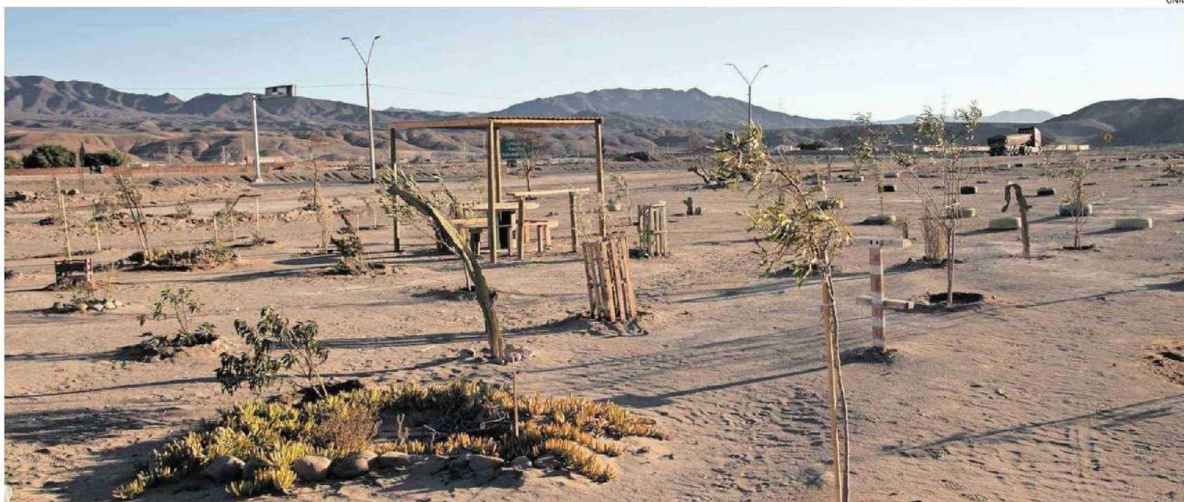
LAS PLANTAS Y ÁRBOLES EMPLAZADAS A LA ENTRADA DE DIEGO DE ALMAGRO. HAY UNAS BANCAS TAMBIÉN PARA COMPARTIR.