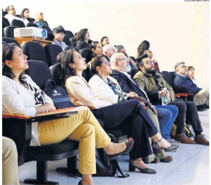
EL FORO REUNIÓ A 40 ESPECIALISTAS EN SALUD.

"Anhelábamos desarrollar esta actividad en la Región de Antofagasta, el poder ahondar en esta temática es algo que nos desafía a diario porque las necesidades en esta zona son distintas a las del resto del pa-