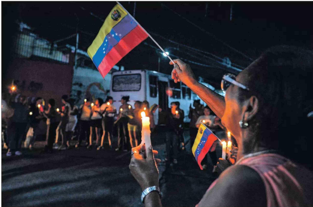
El excanciller dice que Venezuela está entre "continuar con una dictadura bajo la cual todos pierden o iniciar una transición en la que todos pueden obtener menos de lo que anhelan".

Sobre las divergencias de posturas entre el Partido Comunista Chileno (que dijo confiar en que el régimen va a transparentar los mecánismos que validan los comicios) y