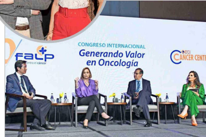
El Congreso Internacional FALP "Generando Valor en Oncología" congregó a más de 550 asistentes.