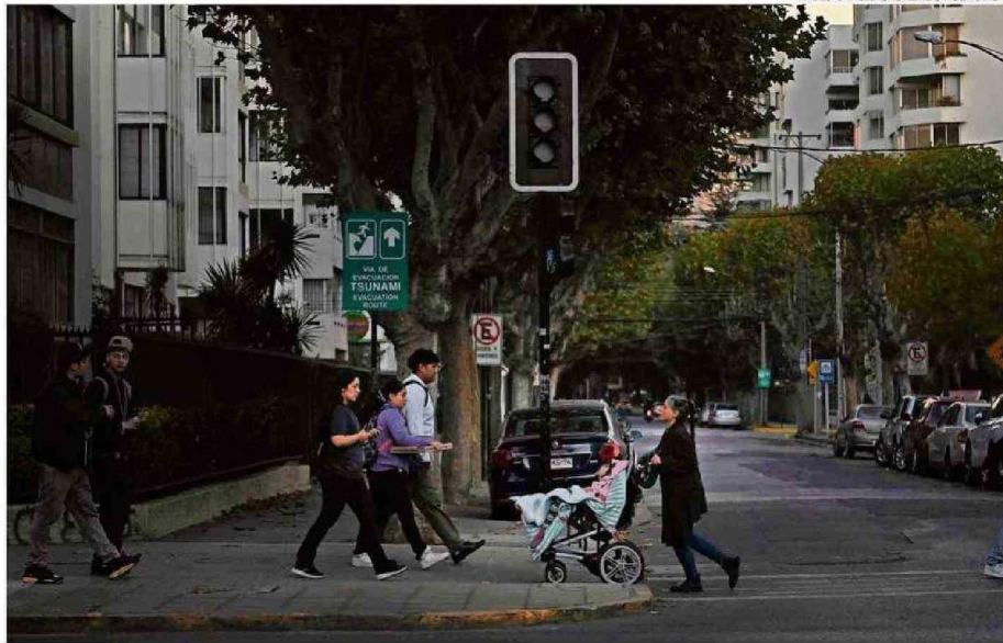
MÁS DE 19 MILLONES DE PERSONAS SE VIERON AFECTADAS POR UN MASIVO CORTE DE LUZ ENTRE LAS REGIONES DE ARICA Y PARINACOTA Y LOS LAGOS.

Pardow señaló además que central la Rapel y la central termoeléctrica Ventanas fueron algunos de los activos de generación que no funcionaron o tuvieron fallas.