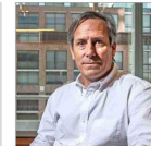
El exsubsecretario de OO.PP. insiste en sus cuestionamientos.

HOY SE REVISARÁ RECURSO CLAVE PARA DEFINIR LA PERMANENCIA DEL DIRECTOR DE CARABINEROS | C1 y C2