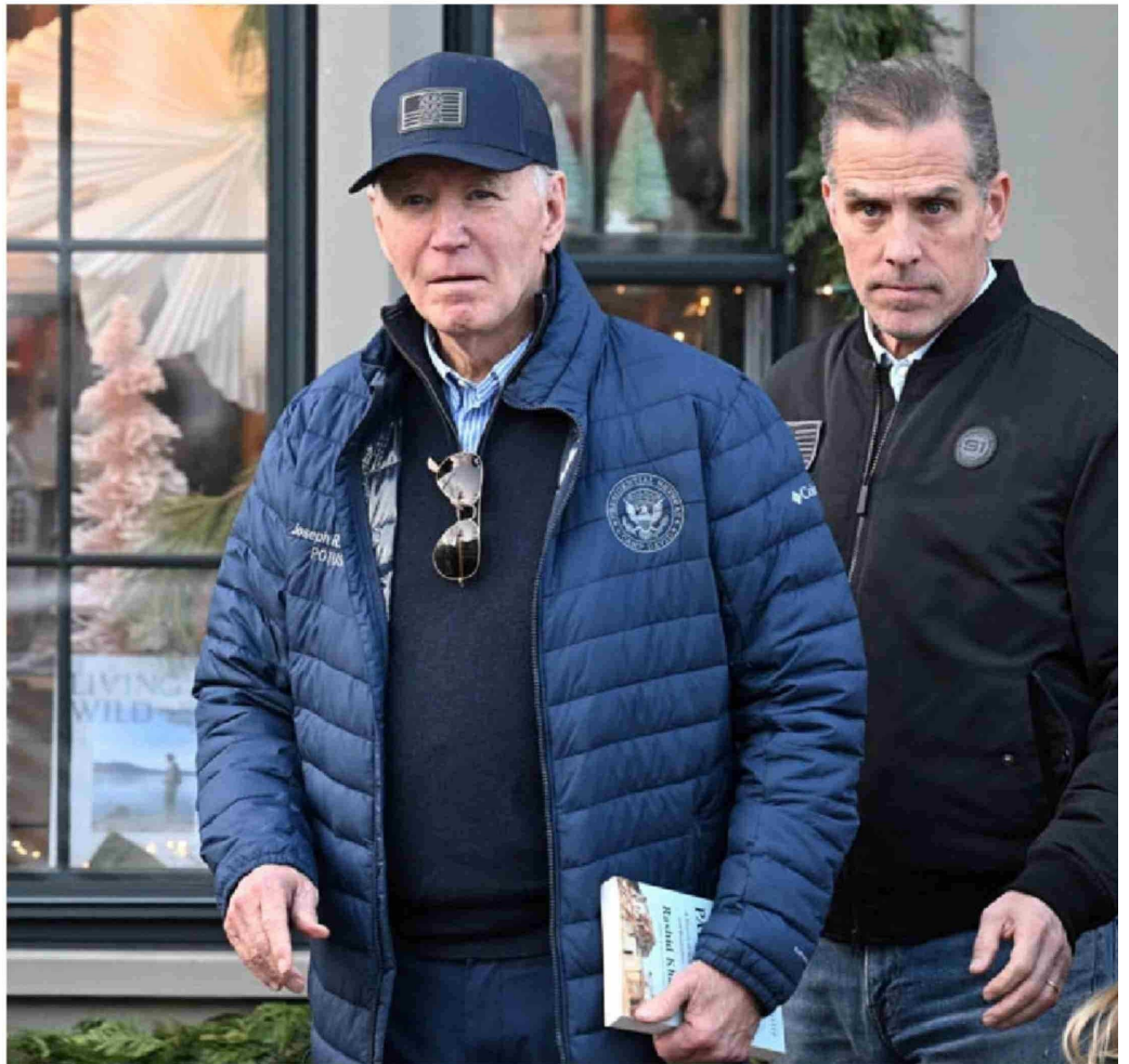
► El presidente Joe Biden, acompañado por su hijo Hunter Biden y su nieto Beau Jr., sale de una librería en Nantucket, el 29 de noviembre de 2024.

Trump se ha comprometido a indultar a las personas condenadas por el ataque al Capitolio del 6 de enero de 2021 y a buscar “retribución” contra sus oponentes políticos, lo que, según los demócratas, amenaza la disposición independiente de la justicia. El