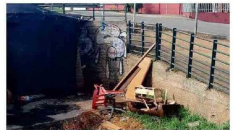
DEJAN BASURA QUE GENERA OTROS PROBLEMAS

Y el problema no solo son las incivildades que generan los habitantes de los rucos. “Dejan mucha basura, colchones, frazadas, ropas, cobertores y como están en el colector de aguas lluvias, todo eso corrió y la tapa del alcantarillado de la esquina de Manuel Montt con Luis Gon-