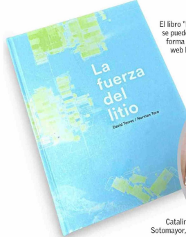
El libro "La fuerza del litio" se puede descargar de forma gratuita en el sitio web lafuerzadelitio.cl