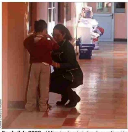
En abril de 2022, el Mineduc lanzó el plan de reactivación educativa, pero los resultados mantienen preocupados a los expertos.

Aunque el Ejecutivo ha destacado mejoras en los indicadores de aprendizajes, asistencia y revinculación escolar, el rezago que dejó la extensa interrupción por la pandemia mantiene la preocupación sobre el desarrollo de los escolares, a la espera de que se evidencien avances sustanciales en la denominada "reactivación".