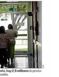
Actualmente, hay 2,5 millones de prestaciones atrasadas.

"corregir, por un lado, los modelos de gestión y de atención del sistema público de salud, para aumentar la productividad del sistema y reducir las brechas entre la oferta y la demanda de servicios de salud". También dice que se debe "diseñar e implementar un modelo de gestión de listas de espera con sistemas de información interoperables que permita detectar y derivar los pacientes en espera oportunamente dentro del sistema público o al privado". Otra propuesta, indica Sánchez, es "flexibilizar en forma inteligente la gestión médica para incentivar el trabajo fuera de horarios normales, sujeto a normas e incentivos claros y bien gestionados y supervisados para evitar el abuso", y "resignar más recursos a establecimientos que claramente lo requieren, pero amarrados a cumplimiento de indicadores y metas, sancionando el incumplimiento".