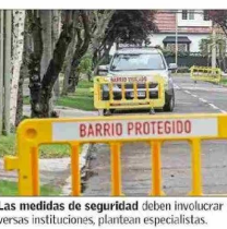
Las medidas de seguridad deben involucrar un esfuerzo mancomunado entre diversas instituciones, plantean especialistas.

Para el exsenador y exsubsecretario del Interior, "el Estado tiene la obligación de recuperar el control de las zonas afectadas por la delincuencia y el crimen organizado" (L.) (mediante) una estrategia integral de largo plazo, más allá de los gobiernos de turno, que aborde los desafíos urbanos, equipamiento e infraestructura". Añade que "luego la estrategia debe considerar incentivos económicos para las familias y municipios para la reinserción escolar de jóvenes desahuciados, instalación de 'oficinas de oportunidades laborales' de cooperación público-privada para dar trabajos lícitos a jóvenes y adultos".