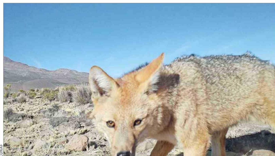
Solitarios. Los zorros ( Lycalopex culpaeus ), que están distribuidos entre Arica y Magallanes, son uno de los depredadores más comunes en la precordillerana provincia de Parinacota. Aves, roedores, entre otras especies de menor tamaño, destacan en su dieta carnívora.

Entre guardaparques también hay una mayor presencia femenina. Además, los turistas son guiados en sus extensos recorridos por bofedales, lagunas, salares, volcanes, senderos y miradores —de la flora, la fauna y el paisaje cordillerano— por personal de la Conaf, lugareños y tour operadores especializados.