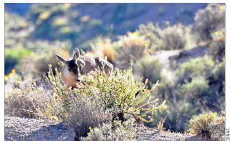
ESCASAS. — La taruca ( Hippocamelus antisensis ) es un ciervo pequeño que tiene un tamaño menor al del huemul, llegando a un máximo de 100 centímetros de altura. Junto a los suris, es una de las especies más difíciles de detectar al mimetizarse con el entorno.