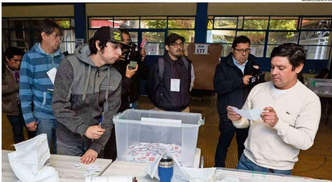
EL 17 DE DICIEMBRE DEL AÑO PASADO SE REALIZÓ EL PLEBISCITO DE SALIDA A LA PROPUESTA CONSTITUCIONAL DEL CONSEJO CONSTITUCIONAL.

se proyecta el crecimiento del padrón electoral de la región, en comparación a la elección de diciembre.