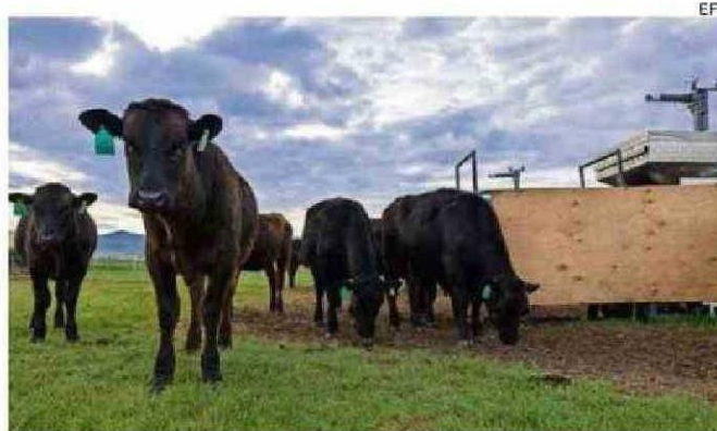
EL GANADO EMITE EL 14,5% DE GASES DE EFECTO INVERNADERO.