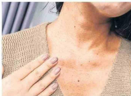
ATENCIÓN CON LAS SEÑALES QUE APARECEN EN EL CUELLO.