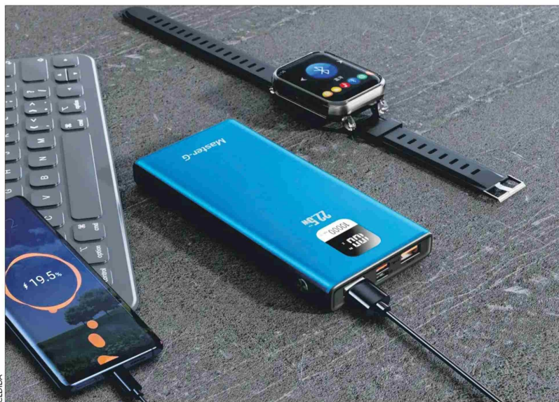
La batería externa Master-G de 20.000 mAh tiene un display donde muestra su porcentaje de carga.

Entendiendo que la carga de los celulares, tablets o audífonos no suele durar todo el día, las baterías externas se han vuelto casi un salvavidas. Hay de todas las marcas, capacidades y tamaños: un ejemplo es la Master-G 20.000mAh UCP20LPD, que destaca por su buena ecuación