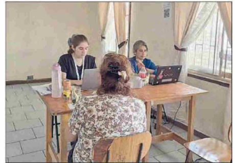
Iniciativa es impulsada por el Departamento de Salud Municipal en coordinación con el Servicio de Salud Viña del Mar-Quillota.