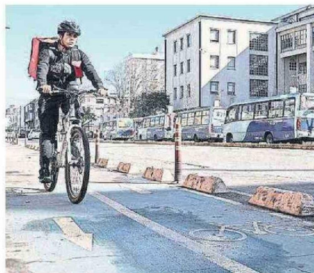
LOS CICLISTAS ESPERAN EN UN FUTURO TENER MÁS CONEXIONES.