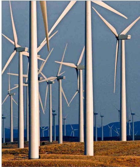
Las principales incorporaciones corresponden a proyectos eólicos y fotovoltaicos, además de sistemas de almacenamiento.

El 56% del stock de proyectos de la Corporación de Bienes de Capital en energía son de generación y el 14% de transmisión. Expertos advierten la necesidad de reforzar la infraestructura para recortar los vertimientos.