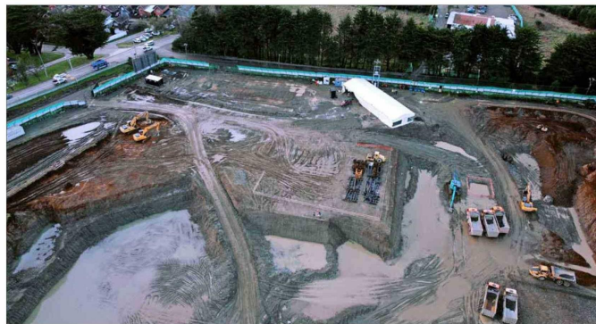
OBRAS. — Ayer se puso la primera piedra del Hospital de Puerto Varas, el cual era demandado por la comunidad hace casi dos décadas. El recinto beneficiaría a unas 158 mil personas, de comunas como Cochamó, Frutillar y Llanquihue.

El CMN confirma que "a partir de lo planteado por la Unidad de Coordinación de Asuntos Indígenas (UCAI) del Ministerio de Desarrollo Social y Familia, instan-