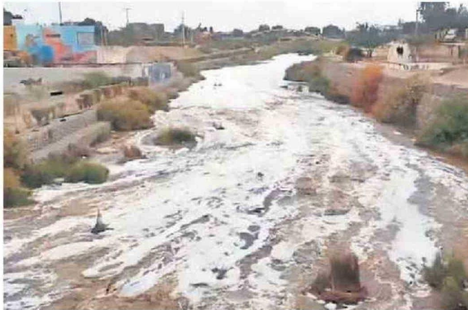
ESTE AÑO LAS LLUVIAS PROVOCARON EL AUMENTO DE LOS CAUDALES DE LOS RÍOS COMO EL RÍO LOA.