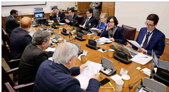
Los cinco miembros del Consejo del Banco Central, encabezados por su presidenta, Rosanna Costa, asistieron ayer a la presentación del IPoM en la comisión de Hacienda del Senado.

El ministro destacó que del informe del Banco Central se desprende una "mejora sustantiva en la trayectoria de la actividad