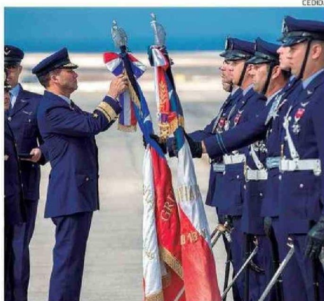
LA CEREMONIA SE HIZO EN LA BASE AÉREA CERRO MORENO.