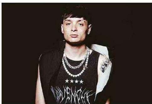
EL CONGRESO INTENTÓ PROHIBIR LA NARCOCULTURA PERO EL PROYECTO "LEY PESO PLUMA" FUE ARCHIVADO.

“ Encuentran en la pandilla masculina, en el mundo del crimen, un espacio en el que pueden sentirse muy machos, usar armas, comprar mujeres, tener dinero... ”