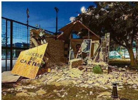
EN CHILE SE HA INTENTADO DEMOLER LOS MAUSOLEOS NARCOS.