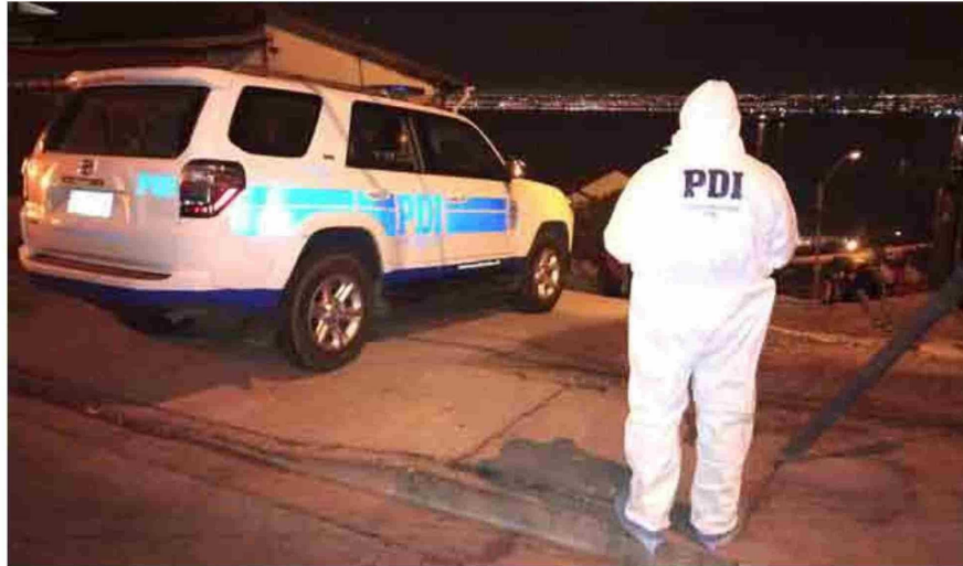
Hasta la calle Teniente Orella de la Parte Alta de Coquimbo se trasladó la BH de la Policía de Investigaciones junto a peritos del Laboratorio de Criminalística.

Un hombre de 33 años fue asesinado durante la madrugada del lunes en plena vía pública del sector de la Parte Alta. Desde el municipio porteño admiten que la comuna enfrenta una "situación complicada", pero están trabajando para "entregar las herramientas necesarias" a Carabineros para combatir la delincuencia.