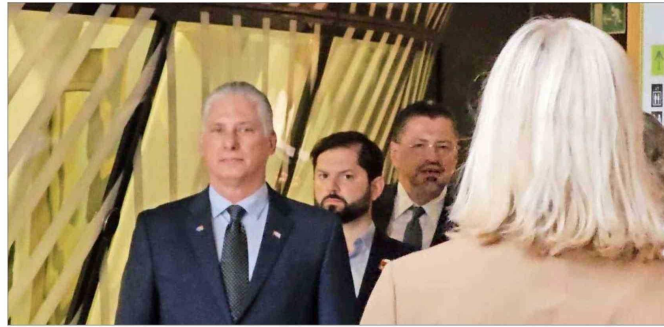
El Presidente de la República, Gabriel Boric, es antecedido en la foto por su par cubano, Miguel Díaz-Canel, durante las actividades de la cumbre Celac-UE en julio de 2023, en Bélgica.

El Presidente ha promovido el término de las sanciones a Cuba, así como también nominó, luego de un tiempo sin representación al más alto nivel, a Patricia Esquenazi como embajadora en La Habana. Se desconoce si Boric tendrá en sus planes viajar a Cuba durante su período, como lo hizo Michelle Bachelet en enero de 2018, antes de terminar su segundo mandato. En el Gobierno indican que por ahora no está en los planes del Presidente asistir a