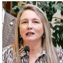
Diputada Catalina del Real (ind.-P. Rep.).