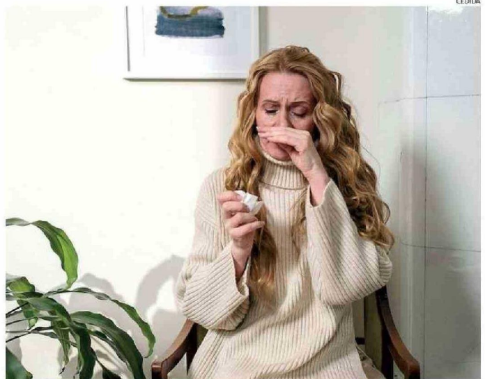
HOY EN DÍA EL COMERCIO MANEJA UNA SERIE DE SUEROS QUE PUEDAN AYUDAR EN ESTAS PATOLOGÍAS.

Mantener el hogar limpio y libre de polvo: En especial en zonas urbanas, donde la exposición a alérgenos co-