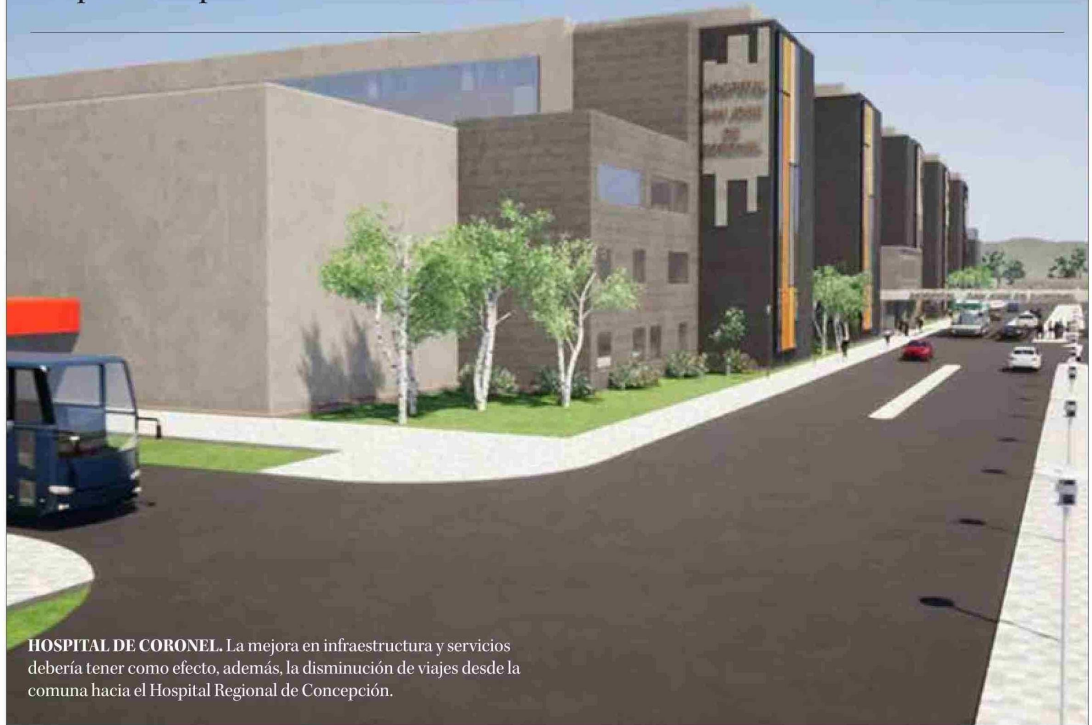
HOSPITAL DE CORONEL. La mejora en infraestructura y servicios debería tener como efecto, además, la disminución de viajes desde la comuna hacia el Hospital Regional de Concepción.