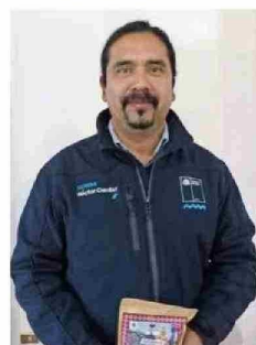
HÉCTOR CUMILAF, seremi de Agricultura de La Araucanía