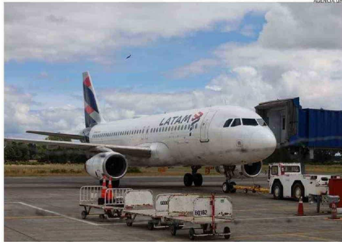
EN EL AEROPUERTO, UBICADO EN OSORNO, OPERAN DOS AEROLÍNEAS CON MÁS DE 2 VUELOS AL DÍA.

operan actualmente la ruta Osorno-Santiago y viceversa: Sky y Latam, las que mantienen más de dos vuelos habilitados todos los días de la semana.