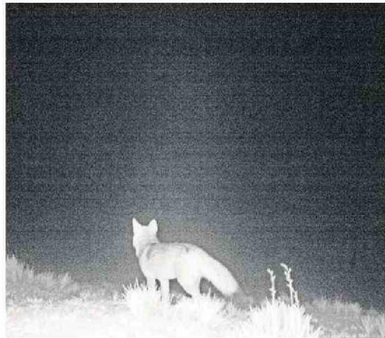
UN ZORRO CULPEO.